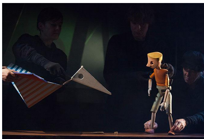
Little Angel Theatre

Volem reflexionar en comú al voltant de l'objecte manipulat com a punt de trobada entre l'obra i l'espectador, entre la voluntat i l'espera, entre l'abisme i la diversió.